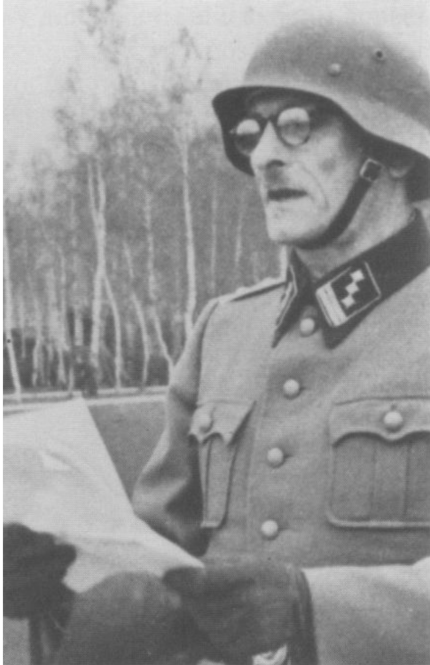
Ваффен-гауптштурмфюрер Дмитро Паліїв, який координував зв'язок між бойовою групою та головними частинами дивізії. Паліїв був одним із найавторитетніших українських офіцерів у військах СС, користувався великою повагою в німців, зокрема в командира дивізії Фрайтата