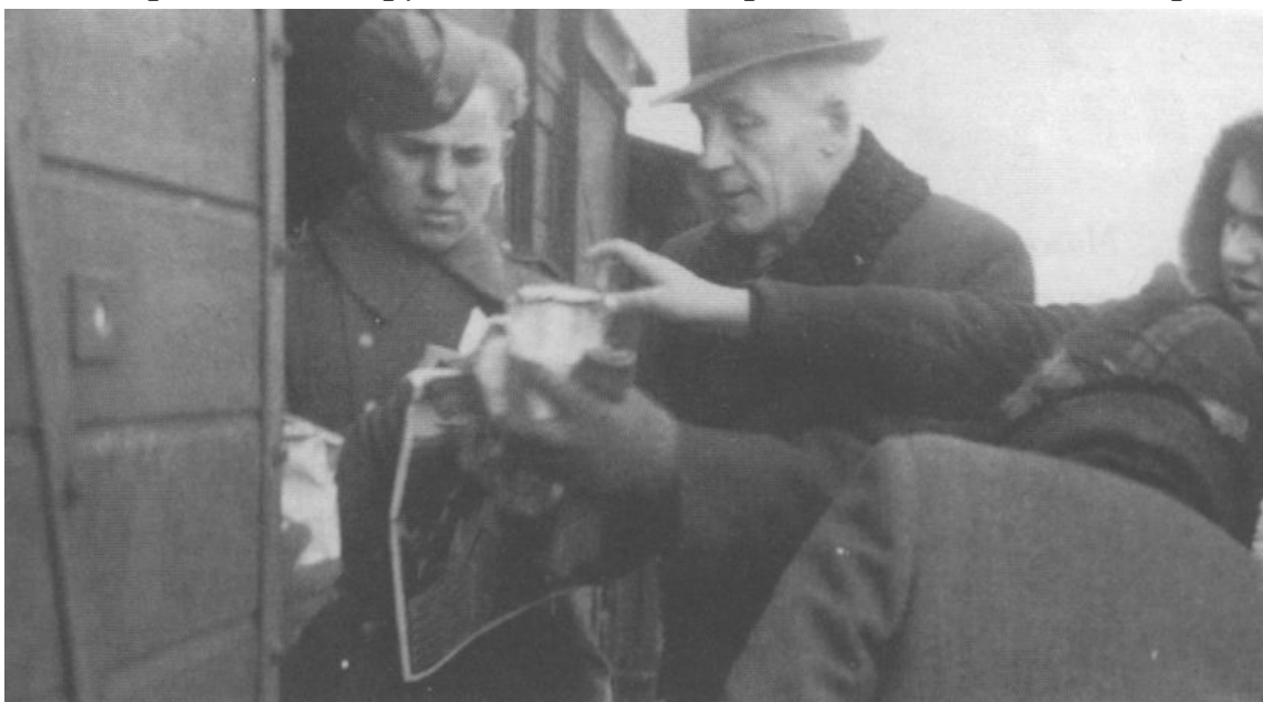
Волонтери дають вояку подарунок