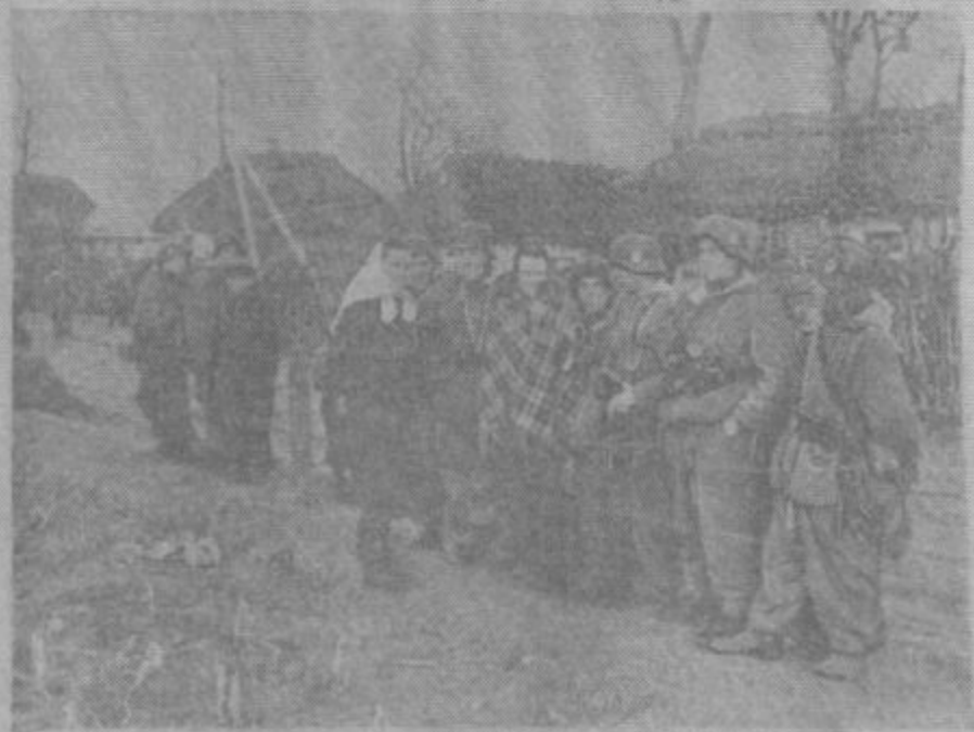
Усюди населення ширю вітає добровольців СС Стрільцями ДніаН Галичини