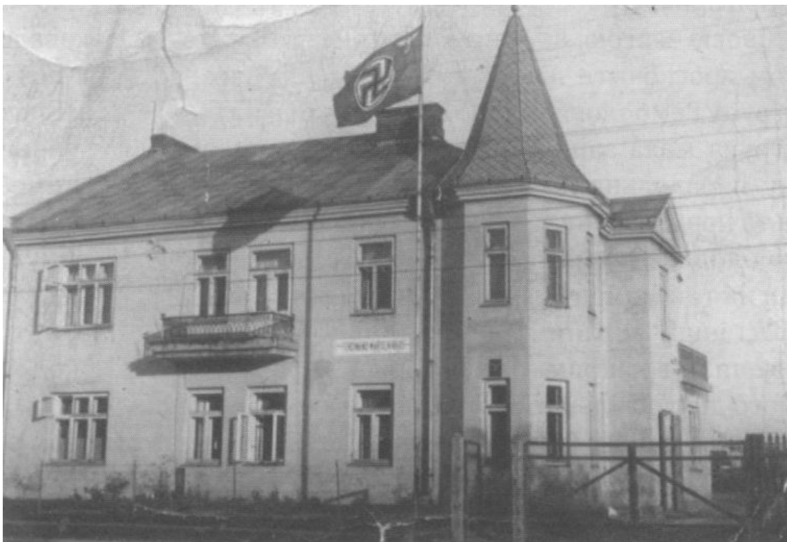
Будівля однієї з німецьких установ у Білгорайі

Тим часом загальна операція зі знищення партизанів тривала. Після бою за село Хмелік бойова група перегрупувалася в Тарнограді, розділившись на дві підгрупи. Перша підгрупа — «А», перебувала під командуванням ваффен-гауптштурмфюрера Івана Ремболовича і складалася із саперної роти, протитанкового взводу та піхотної роти оберштурмфюрера СС Герберта Шнеллера, що її було передано з батальйону Бріштота. Підгрупа рушила на північний захід у напрямку Уланова, де за отриманим радіоповідомленням партизани організували сильний опорний пункт. Усі інші підрозділи бойової групи (штаб, батальйон Бріштота та відділ кавалеристів Долинського) утворили другу підгрупу — «Б», яка прямувала на Білгорай.