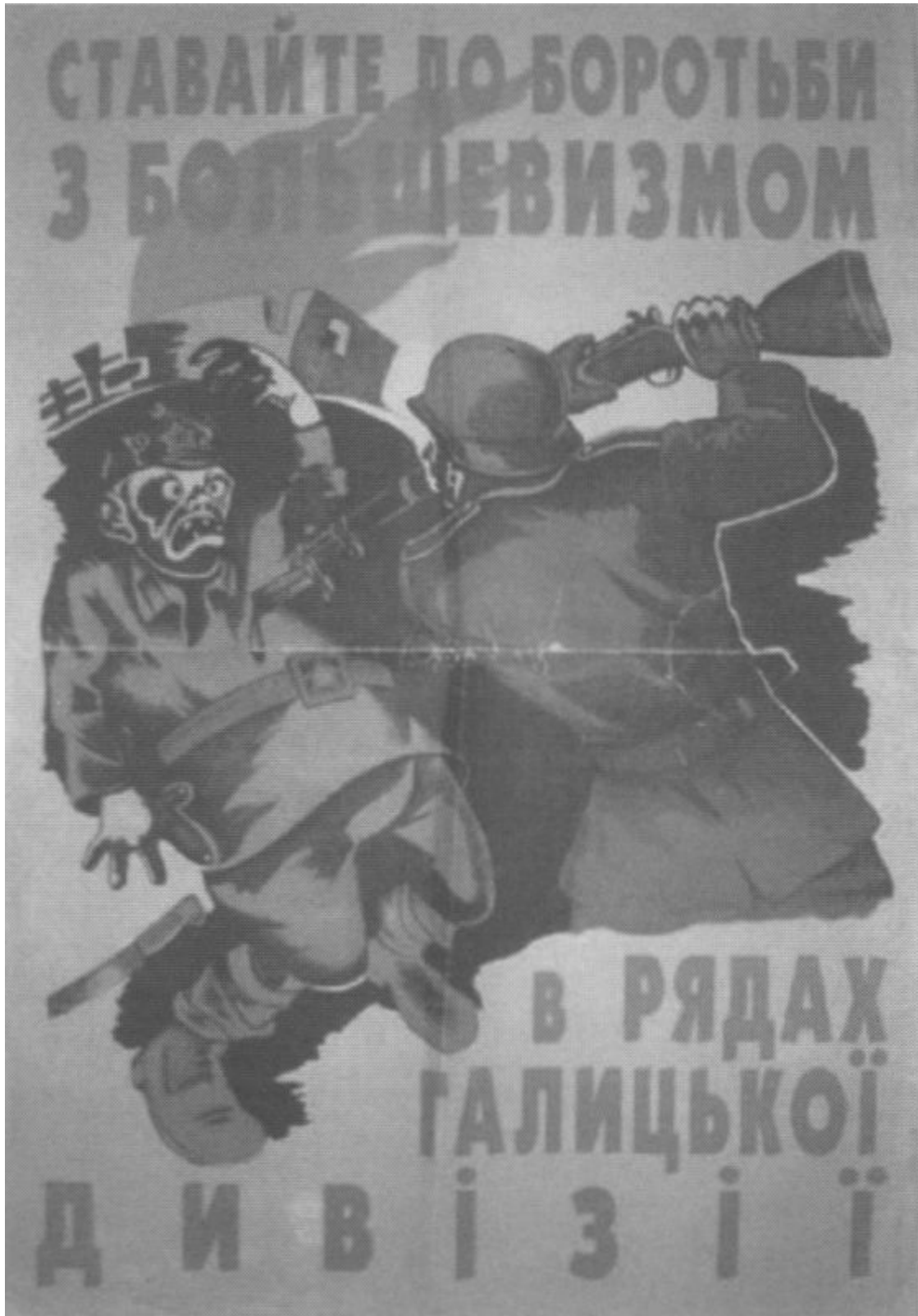
Заклик до захисту своєї Батьківщини від більшовицької загрози постійно лунав з вербувальних плакатів дивізії «Галичина»