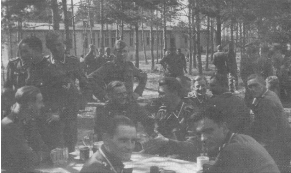
Дивізійники святкують після присяги. Гайделягер

Генерал-Губернаторства. Ця бойова група стала для українських добровольців першою спробою пройти випробування боєм та заявити про себе як про справжніх вояків. У цьому полягало її значення для історії української дивізії та української військової історії.