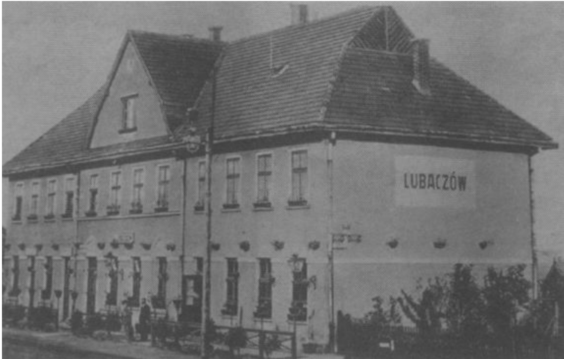
Залізничний вокзал у Любачеві, 1933 рік

Зіткнення біля Любачева стало для радянської сторони сигналом появи в цьому районі потужних німецьких сил. Після цього партизанські відділи почали відходити в район сіл Хмелік — Лукова — Осухи, на схід від Тарнограда. Проте «пильні очі партизанки», часто за допомогою місцевого населення, постійно й уважно стежили за розгортанням та діями есесівської бойової групи і частин, що діяли поряд. Відомий випадок, коли двоє вояків бойової групи, які самовільно покинули розташування підрозділу, були вбиті партизанами [81] .