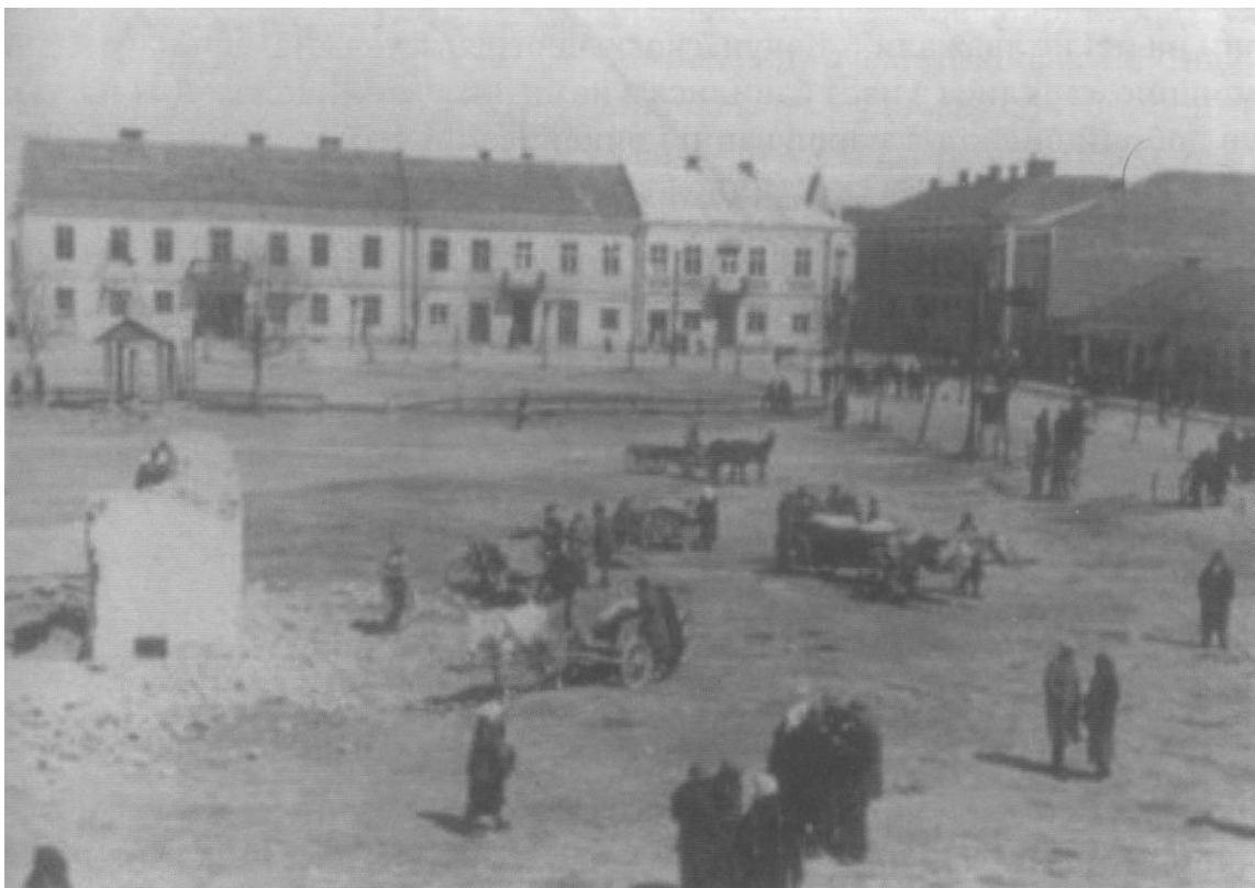
Цешанув. Ринкова площа 1941 р.

вояків зі своїх кавалеристів, піхотинців та мінометників, задіяти штурмові гармати і з ранку наступного дня завдати несподіваного удару по селу К., сподіваючись зненацька зненацька захопити партизанів. За його планом «вся операція повинна була закінчитись до півдня, і, при удачі, лише одиниці з партизанського відділу могли випадково врятуватися». Керівництво і всю відповідальність за цю атаку Долинський брав на себе. Ще перед нарадою Долинський розповів свій план Карлу Бріштоту, який нібито погодився з його доцільністю та особисто погодився взяти участь у цій акції, проте попередивши, що «штаб на чолі зі старим корком (так Бріштот іронічно назвав Байєрсдорфа. — Авт.), напевно, не погодиться». Так і сталося, бо за загальним планом операції Байєрсдорф мав наказ вести атаквальні дії лише тоді, коли його група досягне Білгорою, що мав стати центром розташування бойової групи під час цієї антипартизанської акції. До того ж, враховуючи маневровий характер дій партизанів, навряд чи вони затрималися б у тому селі більше, ніж на добу (до цього моменту ми повернемося трохи пізніше).