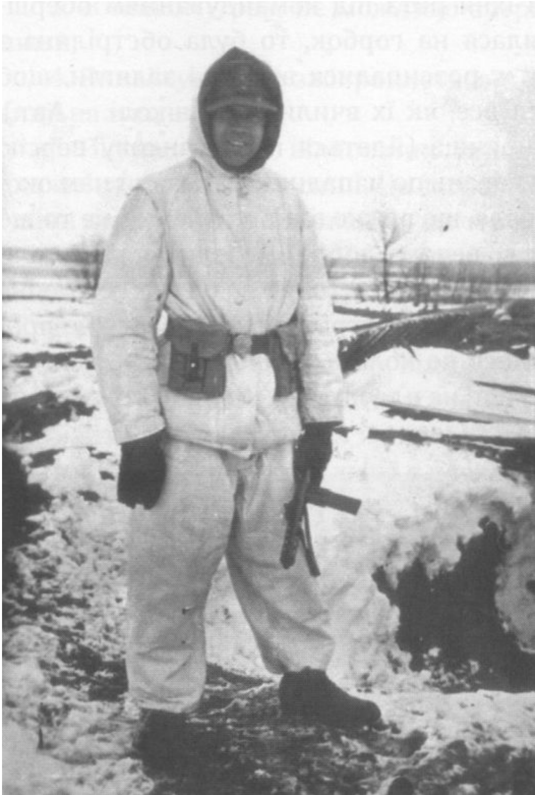
Офіцер бойової групи, німець, озброєний пістолетом–кулеметом MP-35.I «Бергманн». Ці пістолети випускали в 30-х роках для озброєння військ СС та поліції. Усього було випущено 40 000 одиниць.