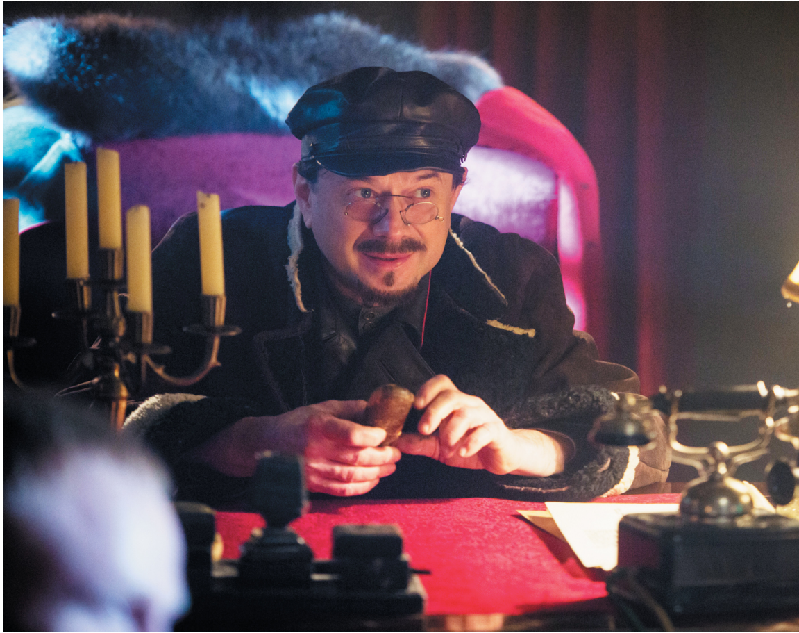
Революціонер Володимир Антонов-Овсієнко (партійний псевдонім: Штик) — один з найактивніших борців проти УНР та інших форм української державності.