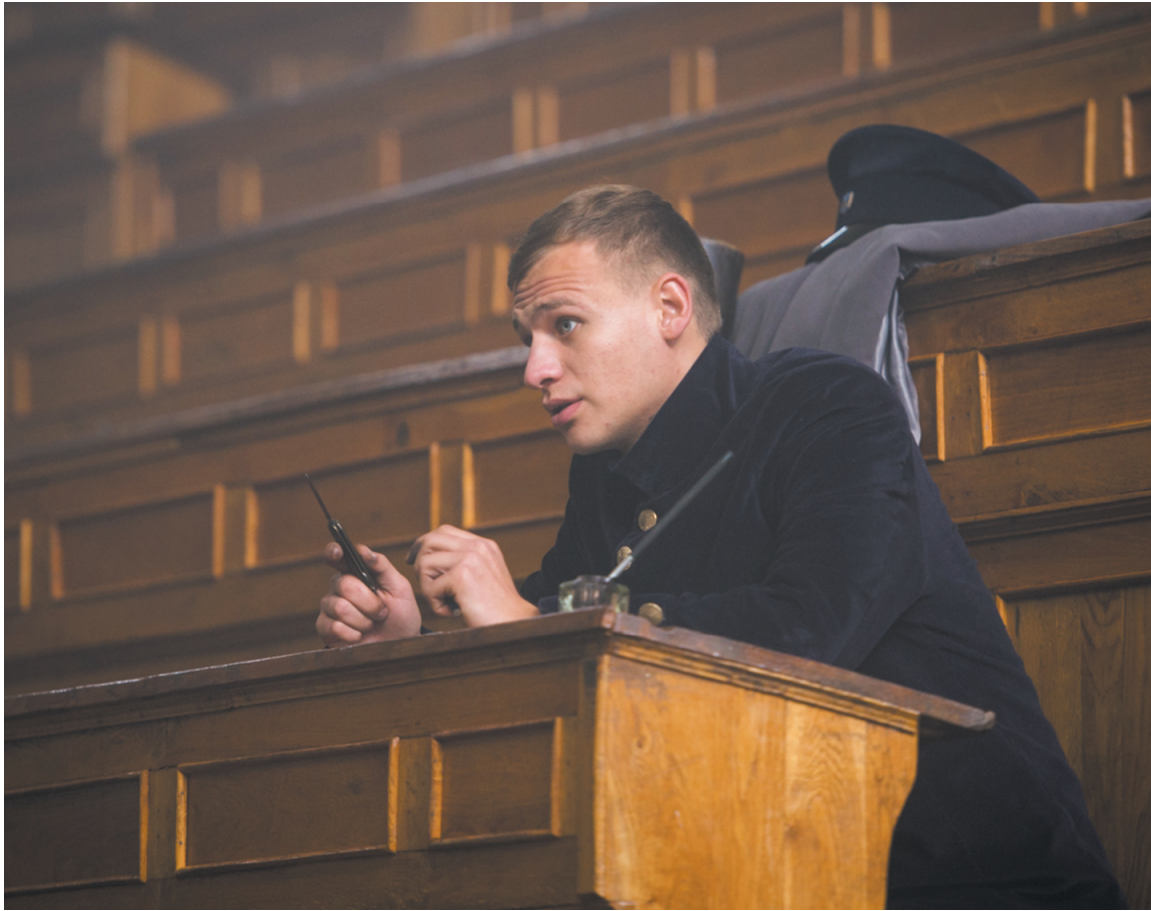
Головний герой фільму Андрій Савицький — студент-картограф Університету святого Володимира.